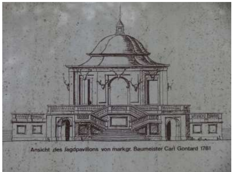
Ansicht des Jagdpavillons von markgr. Baumeister Carl Gontard 1761

1756/57 ließ der jagdbegeisterte Markgraf Friedrich das alte Jagdhaus abreißen und ein neues Jagdschloss bauen. Die Planung dazu hat der markgräfliche Baumeister Carl Gontard erstellt. Neben dem heute abgerissenen Mittelbau, der dem Wohnen diente, waren umfangreiche Pferdestallungen und Nebenräume in der zweiflügeligen Anlage erstellt worden. Heute kann man nur noch den Südflügel, der um 1900 verändert wurde, sehen. Der Nordflügel wurde zu der heutigen Gaststätte umgenutzt.