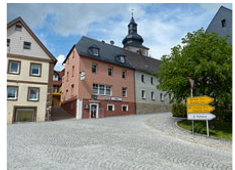
Jugendtreff in der Ortsmitte

Die Volksschule besteht aus fünf Lehrern und 106 Schülern (Stand: 1999).